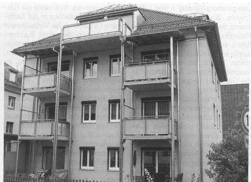
An der Tigaustraße baute die Firma Xaver Schmid eine Wohnanlage, die modernen sozialen Erfordernissen gerecht wird. Der unaufdringliche Bau ist klar gegliedert.