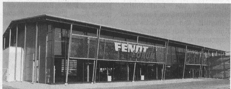
Neu erbaut wurde 2008 das Fendt Forum auf dem Gelände der Firma AGCO/Fendt. Das repräsentative Ausstellungs- und Veranstaltungsgebäude schmiegt sich unaufdringlich in die Umgebung, ohne pompös zu wirken.