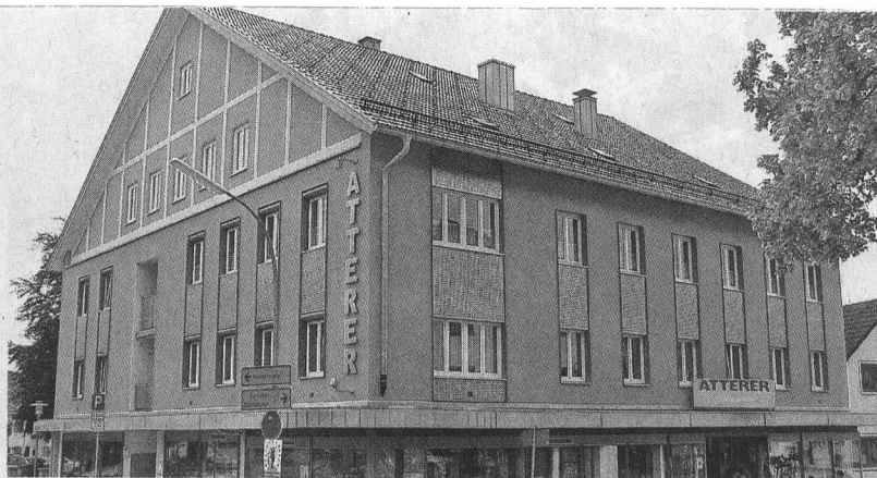
... und das Geschäftshaus Atterer nach der Sanierung. Es wurde technisch und energetisch auf den neuesten Stand gebracht, ohne seine ursprüngliche Gestalt zu verleugnen oder zu verlieren.